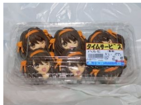
...И ладно бы только вафли!