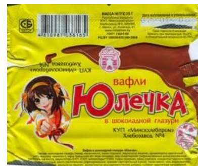
Харухи такая Харухи