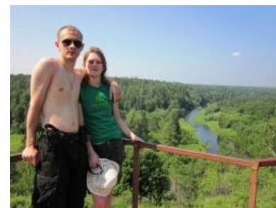
Герой статьи со своей любовницей в Оленьих Ручьях