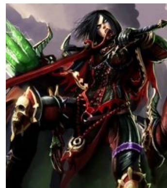
Мириаэль Сабатиэль одобряет фап на нее