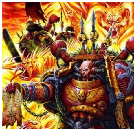
Хаос — это многабукаф