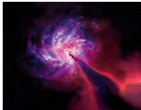
Красивее и ближе вид либо с Кадии, либо из Варпа.

Чёрный Крестовый Поход , он же ЧКП (Black Crusade) — массовый туристический вояж по Галактике, регулярно проводимый хаос-спейсмаринами из Ока Ужаса, с целью на народ посмотреть, себя показать. Очень напоминает собой школьную экскурсию. Бессменным вожатым на протяжении вот уже тринадцатый ЧКП является Абаддон. При приближении ЧКП Имперская Гвардия срет кирпичами, кадианцы ими же чистят винтовки, спейсмарины дряят доспехи, флот прогревает реакторы. Несмотря на тотальное превосходство во всем вообще, дюжина Походов закончились без особых результатов (силы Хаоса обычно наносят громадный урон, вывозят в Око кучу добра, но основную цель похода так полностью и не выполняют). Надо полагать, причина такого дивного для хаоситов постоянства в том, что Богам Хаоса доставляет сам процесс срача между людьми и сопутствующие ему явления , а на победу их жалких прислужников Четвёрке наплевать . Вот и тринадцатый ЧКП так же закончился неоднозначно: с одной стороны, кадианские врата таки были прорваны, Кадью снесли нахуй, а с другой — хаоситы проебали в процессе весь флот и почти всю армию. Впрочем, это не мешает хаос-спейсмаринам считать себя очень крутыми. В настоящее время собирают силы на четырнадцатый ЧКП, который, скорее всего, поперет дальше в сегмент от планеты к планете. Хаос такой Хаос... Сидим, смотрим, ждем .