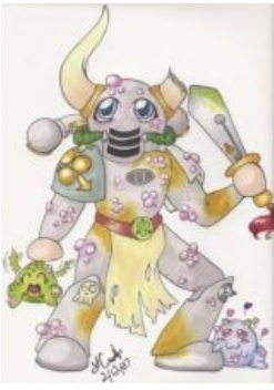
Чумной десантник, ня!

неудачного эксперимента колдуна Аримана по избавлению легиона Тысячи Сынов от мутаций Хаоса. В некотором смысле эксперимент удался — все десантники легиона, кроме колдунов, таки избавились от мутаций вместе с телами, превратившись в ожившие силовые доспехи, послушные, дисциплинированные и исполнительные, хотя и несколько тормозные. Умеют стрелять из обычных болтеров адскими заколдованными болтами. Чем-то напоминают некронов, так как даже полностью уничтожив доспех, убить самого голема невозможно — колдуны через некоторое время вольют его душу в новый доспех, и так ad infinitum. Служат только колдунам Тзинча, при гибели которых испытывают фрустрацию и растерянность.