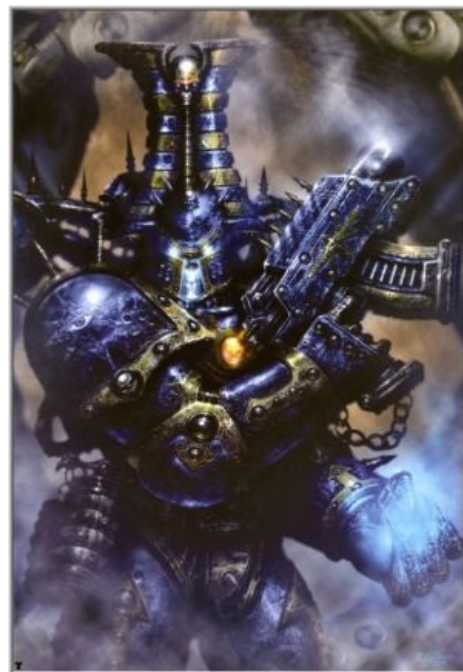
Хаос — это стильно

Повелители Ночи ( Night Lords ) — легион маньяков-убийц, специализирующийся на запугивании . Украшают доспехи стильными черепами с кожистыми крылышками, в целом придерживаясь готического имиджа (благо мертвенная бледность и черные глаза к этому располагают). По роду занятий были хаоситами ещё до ереси, разве что устраивали геноциды и массовые бойни под клич «За Императора!». Знамениты своими навыками разделки туш неугодных и психологической войны, в результате которой целые сектора начинают колотиться в истерику. Нападают из засад под мозговыносящий вой а-ля назгулы, заставляющий доведенных до предынфарктного состояния врагов переходить в режим безостановочного производства стройматериалов и помирать почти без непосредственного участия самих ночников (как-то раз довели Унитазников до рыданий в воксе и расстреливания драгоценных боеприпасов во все подозрительные тени). По части пыток, Повелители Ночи составляют здоровую конкуренцию гомункулам Темных Эльдар: их пленники могут умирать неделями и месяцами, а сами легионеры от процесса испытывают непередаваемый экстаз. Единственный легион ХСМ не имеющий мутаций вообще , кроме как в виде даров Хаоса. По новому бэку: большинство все-таки