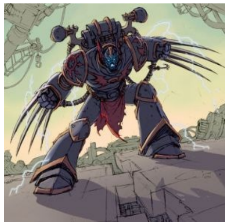
Хаос — это готично