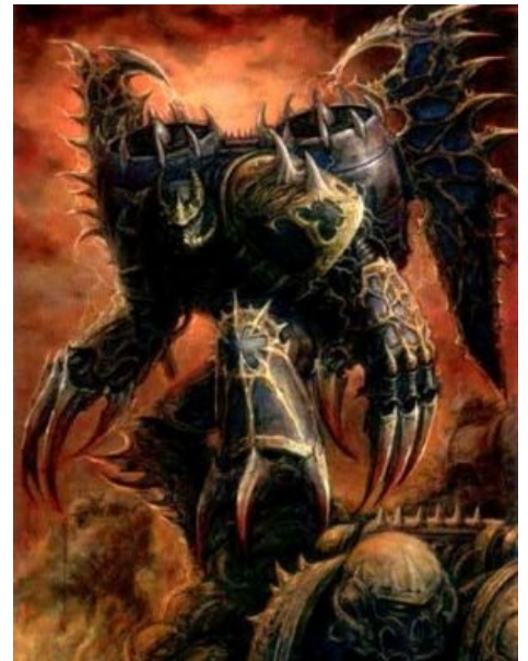
Коготь смотрит на тебя, как на лоялиста

Рапторы ( Raptors ) — воины, экипированные реактивными ранцами, оставшимися со времен «той ещё» Ереси. В отличие от Имперских аналогов, не прыгают, а натурально летают, хотя и медленнее. Из-за сложности использования данного девайса считались элитой. Сабжевые отряды, очень редкие в то время, исполняли особые миссии, связанные с большой степенью опасности. Все эти факторы обеспечили то, что называется « честью мундира » для подобных воинов. Потому рапторы смотрят на всех других ХСМ как на говно, а те отвечают взаимностью. В отличие от штурмовых десантников лоялистов, не дураки пострелять из нормальных болтеров в полете, а чтоб при приземлении