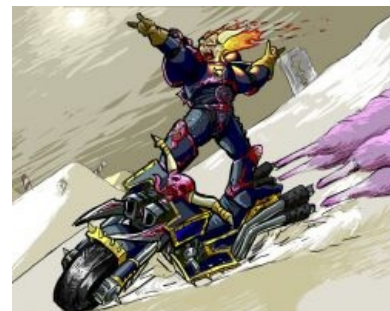
He does cocaine and his head's on fire!