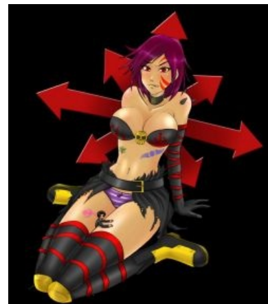
Богиня Чанов , героический разносчик ереси по Галактике.