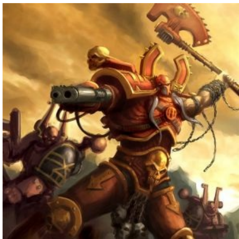
Йаростный берсеркер йаростен.

Культовые десантники — особо верующие XCM, специализировавшиеся на том аспекте, который их богу больше всего по нраву: