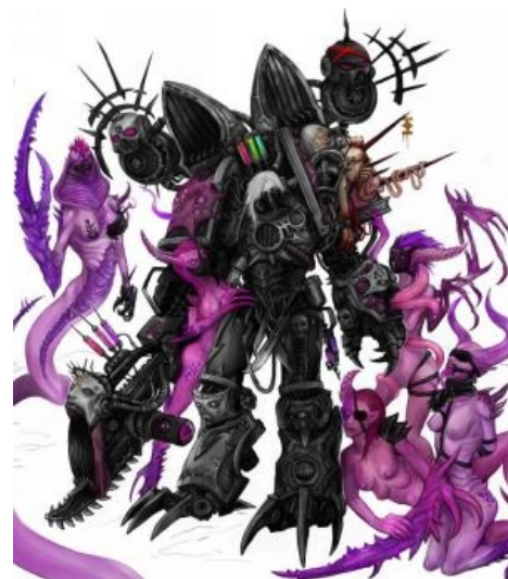
Нойзраптор, с регицидом и демонетками

Шумовые десантники ( Noise Marines ) — результат экспериментов биоманта Фавия Байля по внедрению бесконечной любви к мелодиям Варпа, вещества, расширяющего границы чувствительности, и новых органов в десантников. Носят вместо болтеров охуенно мощную акустику (гитара "Урал" by default), которая разрывает врагов не хуже нормальных человеческих болтов, но прилично скорострельнее и дальнобойнее, а самые обдолбанные из этих товарищей собирают уж совсем лютые звуковые вундервавли, рвущие всё живое и механическое оптом и в розницу. В общем, много дакки. Попытка набить на этих ребят и накостылять, чтоб не шумели, может закончиться крайне плачевно: со скоростью реакции у нойзов дела обстоят не хуже чем у эльдаров, так что половина набигающих может быть нашинкована еще прежде чем успеет замахнуться. Хотя однажды их охуенно мощная окустика дико обосралась т.к. предполагаемая жертва (оглохший термос) не услышала их музыкальных шедевров. Терминальные садисты и мазохисты — очень любят пытки, а их самих пытать бессмысленно — им нраицца. Очень, очень , ОЧЕНЬ сильно мутировали, усилив все свои чувства, но став лицом похожими на каких-то глистов. Шляются по Оку Ужаса, раздавая и получая пиздюли just for loolz, иногда наведываясь в Империум за пленниками, чтоб было кого пытать во славу Слаанеш и пускать на наркоту, а также присоединяются ко всяким ЧКП — либо просто из любви к махачу как к искусству, либо за плату в рабах.