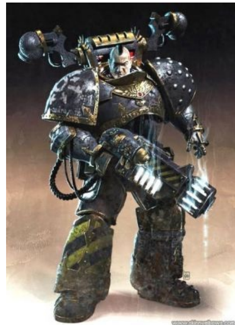
Хаос — это индастриал

Знамениты своими облитераторами , повальной аугментизацией , охуенно мощными линиями обороны и артиллерией. Также умеют впадать в неконтролируемую ярость — «холодный гнев» — от чего в рукопашной не уступают берсеркам Кхорна. Во времена Ереси чуть было не перестали существовать как явление в битве с экспедиционным флотом Имперских Кулаков под предводительством занюханного рядового капитанишки (sic!), но не срослось из-за солдафонства Дорна и безупречной до долбоебизма дисциплины ИК. По характеру большинство ЖВ — мизантропы и параноики , вследствие чего ни на грош не доверяют другим легионам, да и друг на друга косо посматривают, однако далеко не дураки и могут трезво оценивать ситуацию в нужный момент. В пантеон ЖВ входят все боги Хаоса, но настоящим объектом поклонения, фагготии, обожания и преданности для них является их примарх Пертурабо, в котором они видят спасителя от Императора-эксплуататора. Имеют в Очке свою планету-кузницу Медренгард , где держат в анальном рабстве миллиарды человек, клепающих им титанов, пушки, технику и прочие ништяки за нямку , состряпанную в основном из износившихся коллег. Желающим окунуться в атмосферу железных воинов рекомендуются винрарная книга «Железный Шторм», и гораздо менее винрарная (из-за ультрамаринов в главной роли) «Черное солнце». Легион сей горячо любим нердами и гиками, занимая почетное третье место по накалу фагготии.