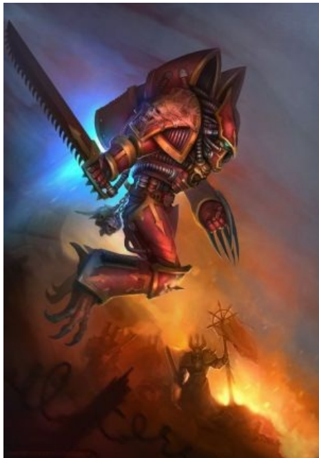
Он улетел, но обещал вернуться

Рапторы ( Raptors ) — воины, экипированные реактивными ранцами, оставшимися со времен «той ещё» Ереси. В отличие от Имперских аналогов, не прыгают, а натурально летают, хотя и медленнее. Из-за сложности использования данного девайса считались элитой. Сабжевые отряды, очень редкие в то время, исполняли особые миссии, связанные с большой степенью опасности. Все эти факторы обеспечили то, что называется « честью мундира » для подобных воинов. Потому рапторы смотрят на всех других ХСМ как на говно, а те отвечают взаимностью. В отличие от штурмовых десантников лоялистов, не дураки пострелять из нормальных болтеров в полете, а чтоб при приземлении