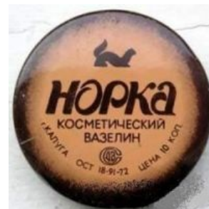
ОСТ аж от 1972 года

https://www.youtube.com/v=AuGTHEFclnw Бизнес-гель