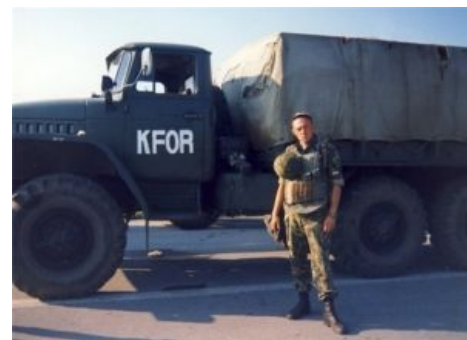
Фото перед отъездом в Боснию

Другими словами, слабость внешнеполитической позиции не позволила России воспользоваться плодами удачной военной операции.