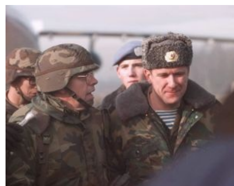
Генерал Майкл Джексон и тот самый офицер