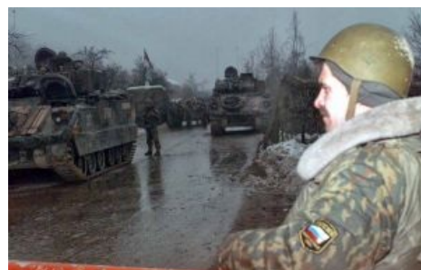
«Анличане за забором»

«У тебя приказ, и у меня приказ! Пиздуй отсюда, иначе я тебя уебу! »