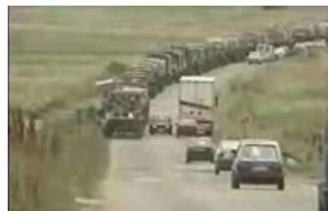
Узкие балканские дороги.

Не встретившие на своём пути сопротивления российские десантники почти успели заехать в Приштину, но тоже были