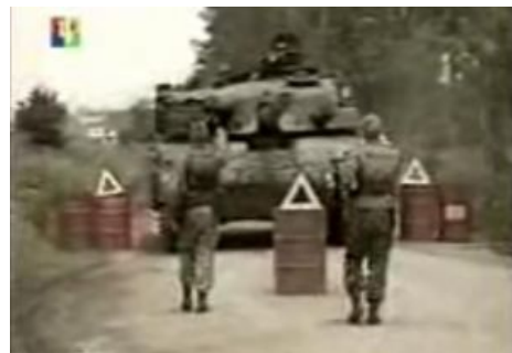
«Сперва честь отдай».