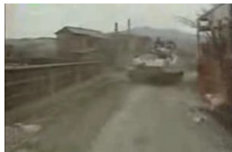
Одинокий английский танк рвётся освободить Косово.

Утром 12 июня колонна расовых английских танков успешно миновала населённый пункт Приштина. Однако её дальнейшему продвижению помешало внезапное препятствие. По одним данным, это был новенький шлагбаум и подтянутый русский офицер в парадной форме, на чистейшем английском языке указавший на невозможность проезда без пропуска, который следует подписать в Москве. По более патриотичной версии, препона приняла обличье рядового, выпранившего покуривавшего сигарету посреди дороги и свободной рукой поправлявшего на плече ремень гранатомёта .