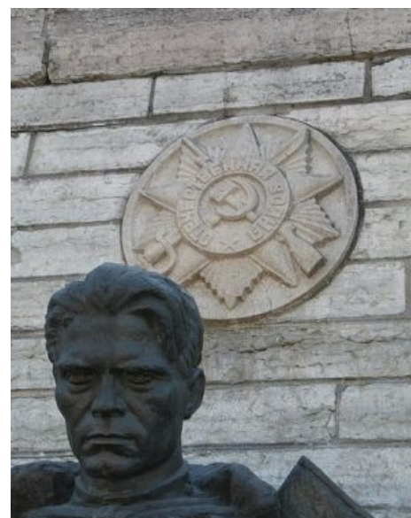
Сабж смотрит на тебя

Некий гражданин Эстонии по фамилии Ансип, как перспективный комсомольский лидер, при СССР-е что-то, видать, слышал про эту историю, но вместо того чтобы помолчать (и, таким образом, сойти за умного), вякнул про «пьяных советских солдат, попавших под танк». И тем самым, по собственной глупости, дал