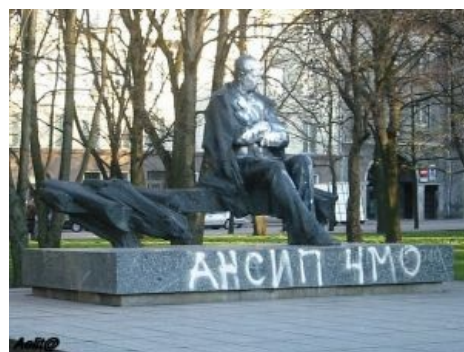
Баттхёрт такой баттхёрт.