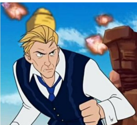
К бою готов!

• Хантер Гезерс — наставник Брока, IRL известный как Хантер С. Томпсон . В отличие от своего прототипа, наркотиками не балуется, гонзо-журналистикой не занимается и в голову себе стрелять даже не думает, зато руководит спецотрядом «S.P.H.I.N.X.», который вроде как тоже сражается со злом, и регулярно строит Брока. Делал себе операцию по перемене пола, в результате которой стал выглядеть как грудастая баба с щетиной и прокуренным голосом, вызывая тем самым лулзы у зрителя, но не вызывая подозрений у простых обывателей мультя. Потом вытащил силикон и пришил хуй на место (так как траповал, в первую очередь, ради внедрения в группу ассасинок). Никого не напоминает? Впоследствии очень скучал по такому своему обличью, но таки остался мужиком, ибо командный дух обязывает.