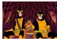
Друзья за любимым занятием