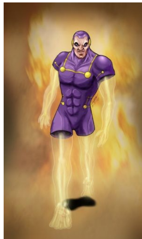
Фантом какбэ намекает, что тебе пи***ц