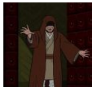
Косплеит Йоду Двадцать Первый