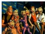
Ребята узрели Неведомую Ёбаную Хуйню