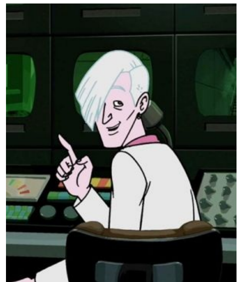
Вайт готов вершить науку

Предназначен быть кибернетическим аналогом швейцарского ножа, но на протяжении первых двух сезонов был нужен, по большей части, лишь для того, чтобы лулзово ломаться всеми возможными и невозможными