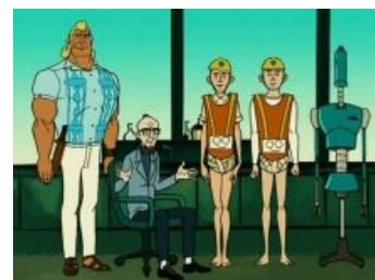
Просто кадр из сериала.

Братья Вентура (англ. The Venture Bros ) — хороший, годный мульт от «Adult Swim» (канала, давшего жизнь таким винам, как « Робоцып » и « Superjail »), нарисованный на флэше и произведенный на свет в 2004 году. К зверолову Эйсу Вентуре и актёру Лино Вентуре не имеет никакого отношения.