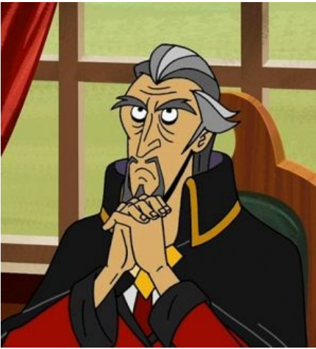
Задумчивый Орфеус задумчив