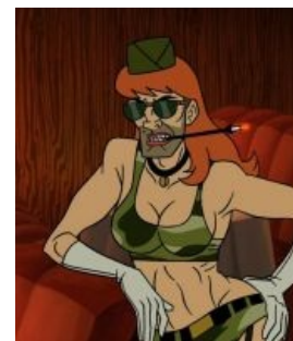
...и его сиськи

Сферический педант, сноб и небыдло в кубе и в вакууме. У сего персонажа довольно долгая история в прошлом многих ГГ, там где Расти учился — Фантом преподавал, что тоже какбэ намекает. Несмотря на кучу фейлов никак не желает угомониться и продолжает терзать ГГ, планируя жуткохитровыебанные и жестокие планы мести всем своим обидчикам в общем и каждому в принципе. На момент повествования пытается замутить что-то вроде собственной Лиги Несправедливости с ещё двумя неудачниками. Носит сиреневое с жёлтыми элементами трико, смехотворную маску из теней для глаз, раздражающие тонкие усики и на первый взгляд кажется обрубком человека, висящим в воздухе, так как руки и ноги его обычно совершенно невидимы. При этом может убить человека одним рукопожатием .