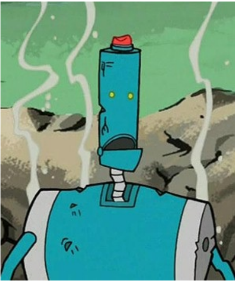
I'm ok, just tired

способами , возвращаясь в следующей серии целым и невредимым. Потом взорвался. Потом его вшили в Брока. Потом он вернулся в качестве боевого тренажера и перешел в эпизодники.