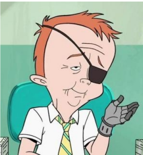
«Правда, я похож на Аску?»