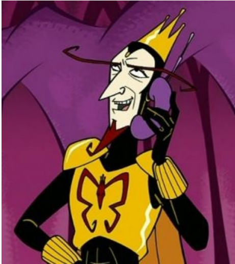
Монарх выходит на связь

По состоянию на конец седьмого сезона (2018 год) вновь несёт службу телохранителя, попутно контролирует дока, корректируя поведение онного согласно приказам разведки. Внезапно открыл в себе любовь к сильной женской руке и бытию сабмиссивом.