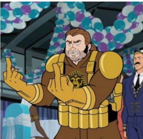
Я устал, я уйду