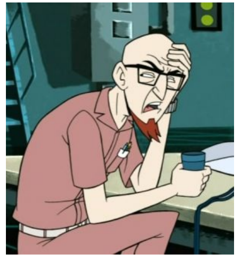
Расти в типичном своём состоянии

В утробе матери натурально захохотал своего брата-близнеца, из-за чего тот все последующие сорок с лишним лет рос в Расти на правах грыжи. Сыновей своих не любит и при удобном случае использует как доноров органов для себя любимого. Помимо всего прочего, имеет еще и внебрачного сынулю, который получился таким же говнюком, как и его родитель. Получил в наследство огромную корпорацию «Вентура индастрис», которую почти полностью просрал : космическая станция разбилась, работники бастуют/разбежались, исследования не проводятся, производственные участки стоят . Вследствии этого док продал всё более-менее ценное и сдает бывшие лаборатории разным темным личностям. Несмотря на всё вышесказанное, обладает удивительной способностью вылезать сухим из воды даже в тех ситуациях, когда остальные получают неиллюзорных пиздюлей (хотя жертвой членовредительства бывал, и не раз). Алсо, таким, какой он есть, вероятно, стал из-за постоянного торможения отцом-энтузиастом.