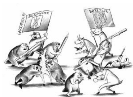
С. Корсун. Бобро забарывает козлу!

В Ленинградском университете, — рассказывал Лев Николаевич, — шел экзамен. Одной студентке достался билет, в котором был вопрос о воззрениях Руссо. Ей подкинули шпаргалку. Но тот, кто это писал, букву „д“ выводил, как „б“, с хвостиком наверх... И вот вместо того