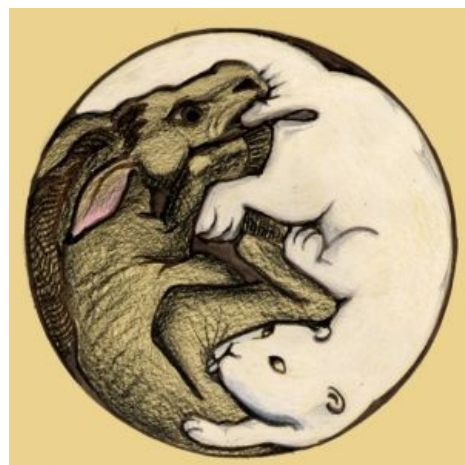
Наглядный даосский символ

«Человек по природе либо бобр, либо склонен козлу »