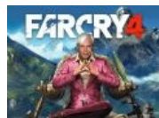
Да озарит вас свет Бориса Моисеева!