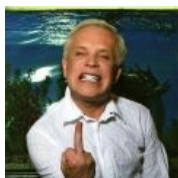
И тут я пальцем к-а-а-к...