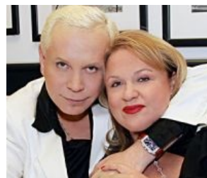
Боря душит свою избранницу