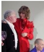
Ани запаланили! Боря и Сереза как бы говорят нам...