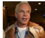
Ну разве не няшка?