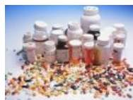
Скушай веществ, пациент