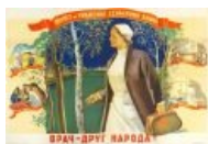
Пропаганда, сэр. Путин ставит диагноз по юзерпикам