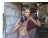
Та самая тень