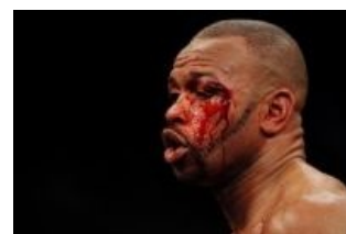
Рой Джонс внемлет аргументам

читерский приём, позволяющий выиграть не выводя противника в астрал. Даже если по очкам идёт проигрыш, сделать это (теоретически) не очень сложно — достаточно навесить противнику хорошее рассечение или иное увечье, которое не позволит ему спокойно продолжать бой. Чем пафоснее состязание и ближе к победе была жертва технического нокаута, тем фееричнее следующие за этим бурления говна и эпичнее срачи и драмы. Например, победа Дэнни Грина в поединке с Роем Джонсом за титул чемпиона. Формальным поводом стала замусоленная кровью морда Джонса — несмотря на то, что он ещё передвигался по рингу, бой прекратили.