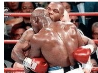
Аргумент Железного Майка

При выдвижении аргументов джентльмены ограничены простыми, но строгими правилами: