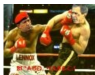
Буш vs Чавес