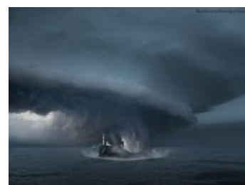
Фантазия на тему

А на самом деле, посудите сами: акватория этого самого треугольника во времена расцвета мема являлась (да и сейчас является) одной из самых «загруженных» транспортом в мире. До середины 60-х, с октября по март трансатлантические пассажирские суда и самолёты из/в Европу старались следовать по «южному маршруту»: можно было доплыть/долететь до Майами и пересечь на внутренний авиарейс, благо их было много и на любой вкус. К тому же, здесь зарождается огромное количество ураганов и циклонов, то есть погода в треугольнике, мягко говоря, не из лучших в мире, как в любом, уважающем себя центре образования погоды (дер калт Лабрадорского течения смешиваясь с теплым-ламповым-ласковым Гольфстримом (нежность которого прогревает также и Мурманск долгим зимним вечером) порождает все эти ваши Катрины ). Кроме того, не особо удобное для судоходства Саргассово море . Поэтому и шансов пропасть здесь намного больше.