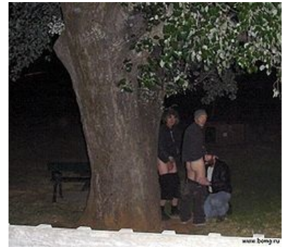
Так выглядит сельский гейклуб

«Мальчики мои, вы все такие красивые, но стоит лишь упомянуть о гомосексуальности, большинство из вас сразу начинает исходить злобой и брызгать слюнями, как будто злые и страшные пидарасы только спят и видят, как склонить вас к мужеложеству. Причём, абсолютное большинство тех, кто гордо именуется «гомофобами», то есть теми, кто по идее должен бороться со всеми проявлениями гомосексуальности, с огромным удовольствием потребляет лесбийское порно. Что говорит нам не об «идейной» гомофобии, а о банальном (об анальном) страхе за свою жопу, предположим, в местах не столь отдалённых , не говоря уже о слегка наивном мнении, что, по сути, презирая роль «пассива» в сексе, они лишней раз демонстрируют своё мужество и силу, и от сего нравятся женщинам ещё больше, хотя на самом деле не понять такой тонкий намёк может лишь известная категория дам. Однако такая мысль обычно не останавливает злокачественных гомофобов, свято верующих в то, что мозг женщины и мужчины различается где-то так же, как мозг Чужого и Хищника, и что девушкам должно быть противно смотреть на гомосексуальные отношения между мужиками, зато они должны обожать гомосексуальные отношения с подобными им. Кроме того, нормальному человеку обычно нет дела до того кто с кем предпочитает трахаться, и уж слишком большой интерес и громогласная борьба с гомосексуальной еблей вызывает вполне логичные мысли... »