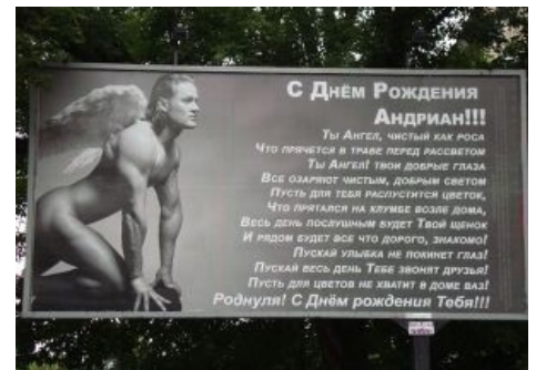
Высокоухоная картинка из блога ахтунга на улице.