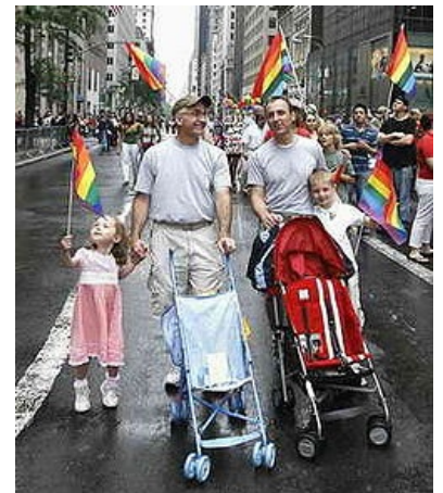
Приобщение детей к либерастическим ценностям