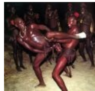
культурные традиции афро-ахтунгов