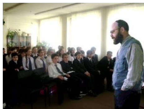
Асов в иешиве