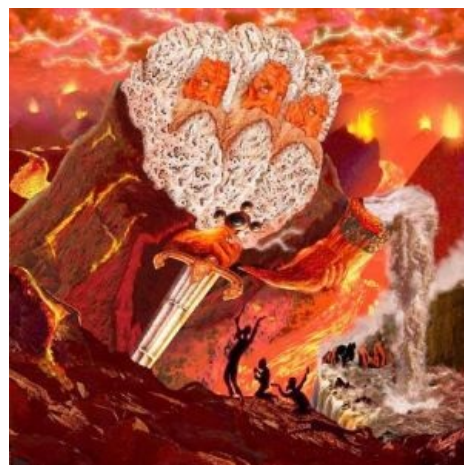
Одна из картин поцыента [2]