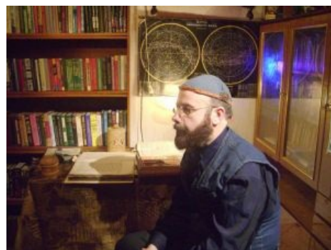
Асов в кипе