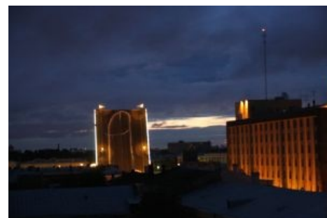
Большой Вселенский Космический Хуй

Запись об акции в блоге pluser'a с подробным отчетом, фотками, видео и коллекцией ссылок на СМИ была засуспенжена, но замечательнейший Плущер сделал репост .