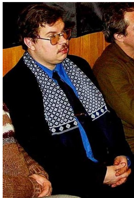
Респектабельный издатель дремлет на очередном съезде