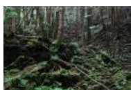
« Ваша жизнь является бесценным даром от ваших родителей. Подумайте о них и о вашей семье. Вы не должны страдать в одиночку. Позвоните нам: 22-01-10 » — это последнее что ты увидишь... [2]