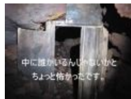
Вход в пещеру