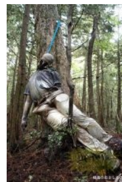
Кризис? Не, не слышал

В лесу Аокигахара за последние полвека различными способами лишило себя жизни более 3973 героя. Это только обнаруженные. По значимости для сведения счетов с жизнью Аокигахара занимает почетное четвертое место , после Золотых ворот в Сан-Франциско, Нанкинского моста через Янцзы и виадука Принца Эдварда. И это без поправок на то, что с моста прыгают при скоплении свидетелей, а в лес... Ежегодно в лесу находят от 70 до 100 тел. Официально полиция начала заниматься поиском тел самоубийц Аокигахары с 1970 года. С того времени количество обнаруженных тел растёт год от года, прямо-таки на дрожжах... Одними из самых популярных способов погудеть с предками являются раскачивание туловища на ветке и употребление коктейлей из медицинских препаратов. У подножия Фудзиямы висят таблички, призванные посеять светлое и доброе в душах отчаявшихся идиотов. Кроме того, там постоянно дежурит специальный человек, символично называемый «гид», основная обязанность которого состоит в том, чтобы понимать «Who is who», и прогнать ссаными тапками не случайного прохожего, а суицидника.