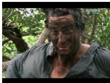
Беар Гриллз немножко уже испытывает таинственное влияние этого леса

На любителей пощекотать себе нервы, чье воображение может воспламениться от всяких мистических слухов и историй, Аокигахара подействует прям таки самым благосклонным образом. Картина маслом: вокруг деревья, деревья, деревья, с веток гирляндами свисает мох с паутиной; тут и там зияют пещеры. Но что самое замечательное, так это девственная тишина, от которой постепенно начинают шевелиться волосы, дергаться глаз и потеть подмышки. Любой шорох может вызвать стойкую паранойю, которая заставляет вибрировать дрожью анус, а яйца — трансформироваться в горошины. Но самое приятное в том, что здесь постоянно кажется, что из сумрачных зарослей и темных пещер за вошедшим в лес наблюдает ... Кто здесь?!