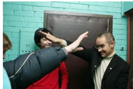
Долбоёб кидает кошерную зигу.

В 2007 году, когда Кровавая Гебня нашла шпионский камень британских спецслужб, Носик, естественно, не поверил . В 2012-ом сами англичане признались, что камень был. Но им он тоже не поверил . Вот такой недоверчивый.