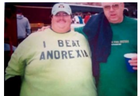
Толстым троллям насрать на анорексию.