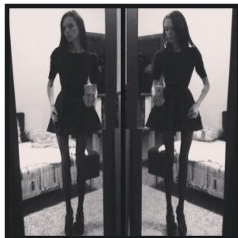
Make me unsee it.

«— У анорексичек нет мозга, ибо он сожран на обед изголодавшимся желудком.