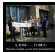
Демотиватор как бы раскрывает суть движения