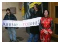
Уникальная акция в Питере