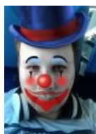
А таким его видят Дакфейс остальные