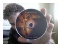
Лапоть и его сраный диск