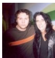
Сабж и Элис Купер