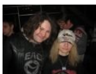
Лапоть и его страшноблядь