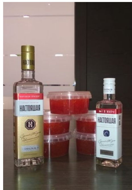
водка настоящая и красная икра