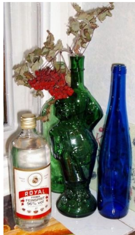
Композиция с Роялем