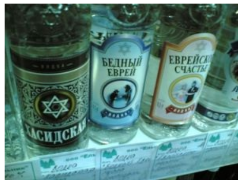
Еврейская расовая водка

Водка как застольный напиток предназначена для придания кулинарно-сопроводительного акцента блюдам исключительно русского национального стола. Прежде всего водка подходит к жирным мясным и мясо-мучным блюдам и солёным острым рыбным: