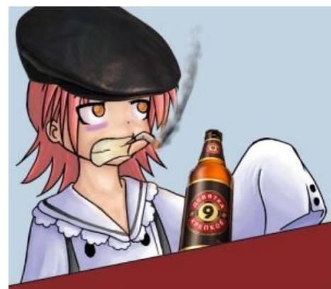
Ракусута одобряет девятку

Нет, это не про машину. И не про футбол. И не про пистолет. И даже не про самолёт. «Девятка» от Балтики — первое в этой стране крепленое пиво, столь любимое в конце девяностых школиём за «торкучесть», по сути — тот же ёрш, но уже готовый к применению. На смену оной пришли позабытые ныне джин-тоник, сидр, ром-кола, отвёртка и «Кровавая Мери» мочаковского разлива, ныне все они вытеснены на обочину истории всепобеждающей Ягой. Среди более возрастного контингента до сих пор популярны ещё более крепкие сорта, вроде «Охоты крепкой», «Амстердам нафигатора» и т. п.. Опьянение от крепленого пива самое тупо-беспросветное и безблагодатное из всех (хуже разве только «хлебный напиток» «Еруслан», к счастью уже канувший в Лету), а последующий отходняк — один из самых омерзительных, с дикой головной болью и бунтом всех внутренностей в брюхе. Запах перегара от подобного «пива» тоже выдающийся — весь великий и могучий русский мат бессилён передать то отвращение, которое он внушает.