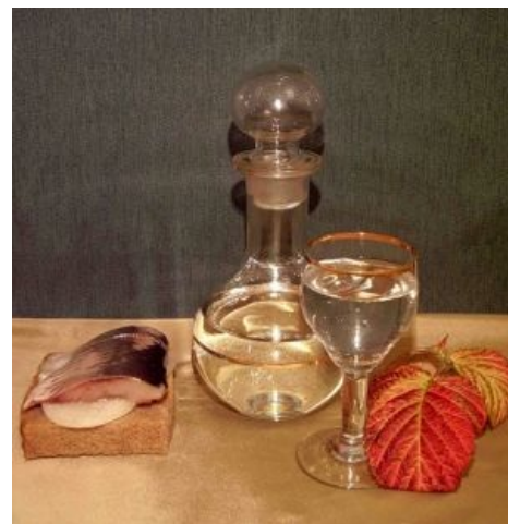
Водка. Простая русская водка

Содержание спирта в водке согласно действующему ГОСТ составляет от 40% до 56% объёма. В странах с прогрессивной акцизной шкалой практически все водки имеют крепость 37,5%, а 40% объёма и выше стоят ощутимо дороже. Получают этиловый спирт для водки по старой доброй традиции — сбраживанием пшеницы для спирта «Люкс» и сбраживанием картофеля или зерна