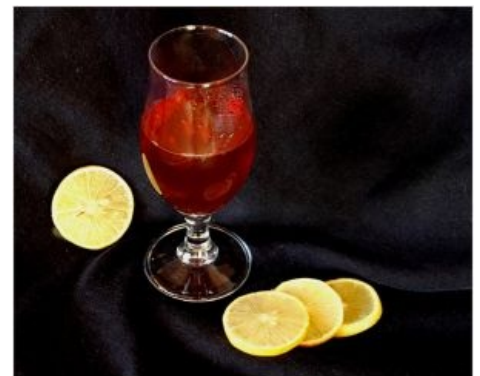
Венец творения (согласно Стругацким)