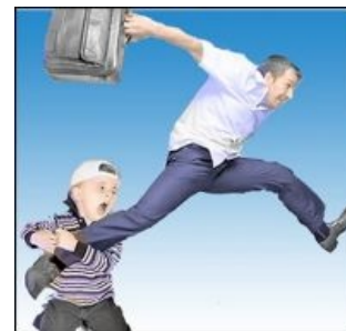
Run, Forest, run!!!

Не стоит забывать, что у нас алименты платят всё-таки на детей, а не на жену (кроме случаев, когда, например, была иждивенкой). Но получает и тратит их именно жена! Система обеспечения алиментами именно ребёнка со всем положенным контролем и анальными карами, если жена потратит хоть копейку на себя, а не на ребёнка, в России отсутствует напрочь. Впрочем, в Америке деньги часто идут именно супругу, тому, который сможет доказать свой уменьшившийся доход и т. п., и тоже ничего хорошего не получается. Известны различные методы оптимизации алиментообложения: