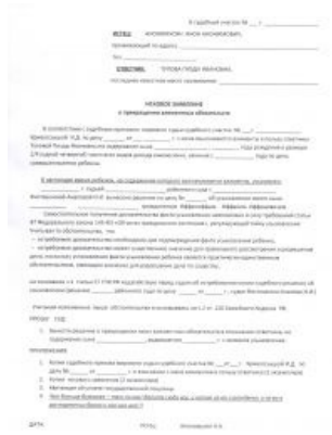
Образец искового заявления

прекращении выплат при наличии объективных обстоятельств в виде уже вступившего в силу решения об усыновлении. Лулзы в изрядных количествах извлекаются после первого же звонка или СМС от нее с вопросом: «А почему ты перестал платить?». И напоследок — решение суда о прекращении алиментных обязательств получайте в канцелярии не сразу (не жадничайте), а по истечении двух недель, когда на нем уже будет стоять волшебная отметка о вступлении в законную силу. Контрольный выстрел — сразу занесите копию вступившего в силу решения вашему приставу — распиздяйство, лень и глупость в этой системе никто не отменял.