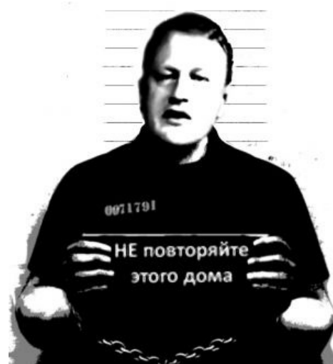
Кровавая гэбня как бы намекает нам.