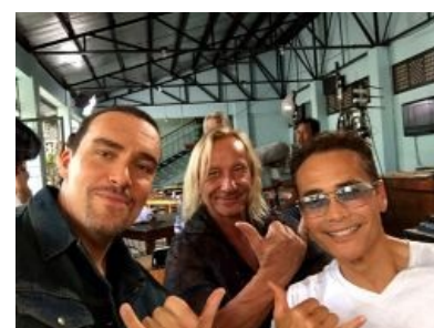
Метод работы над новым блокбастером

Александр Невский - Mister Вселенная! Пр-конференция Знаменитое интервью. Кто дает Александру Невскому деньги на фильмы // [Котік] Кто дает Александру Невскому деньги на фильмы.