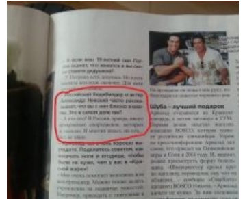
А разгадка одна