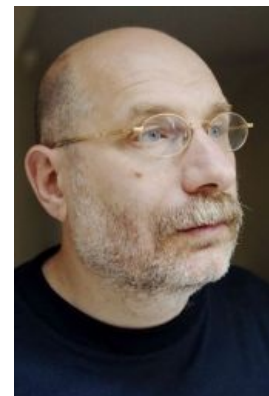
Григорий Чхартишвили с печатью интеллекта на лице.

«Если спрошено будет, чьи произведения хуже: Донцовой или Акунина, ответствуй — Акунина, ибо Донцова плохие книги пишет плохо, а Акунин плохие книги пишет хорошо, а говну должно пахнуть говном, а не шашлыком, дабы не вводить никого в заблуждение. »