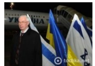
типичный укаинский политик хАзаров

На самом деле сабж является идеологом и создателем карательной системы по выбиванию денег из населения и бизнеса, а также прессования всех неугодных — Государственной налоговой администрации Украины. Сам термин «азаровщина» возник в 2000 году как обозначение дичайшей смеси тупости, непрофессионализма, жадности и жажды наживы — основных принципов деятельности налоговой. По этим принципам работало и правительство Януковича в 2003—2004 годах — стиль работы правительства в экономической сфере был настолько узнаваем, что не оставлял сомнений в его авторстве. Алсо, сабж не останавливался на достигнутом и продолжал насиловать экономику