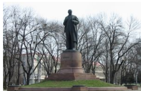
Тот самый майкопский Ленин

Музыкально-свето-фонтан в Майкопе на пл. Ленина. Фонтанирует правильно под музыку (а не туда-сюда брызгающей струёй, типом под музыку) только по выходным когда стемнеет и когда, по сведению луркоморья, «не местные» уже боятся высунуться на улицу