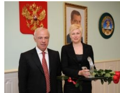
Отличный приз («Хрустальный пеликан» а не то, что вы подумали)

Всё это не мешает некоторым выдающемся адыгейским учОным выступать за возвращение буквы «ять» в русский язык и обнаруживать в истории России царя Николая III. Некоторые «асоба умные» индивидуумы не утруждают себя пустой тратой 5-6 лет жизни для учёбы в университете и запросто покупают диплом, притом умудряются в качестве судьи («хапхахапа») судить в течение порядка 10 лет преступных элементов общества. Выдает таких индивидов жадность, перемешанная с глупостью, когда он, желая стать вечным «хапхахапом», подаёт документы о высшем образовании с ошибками в названии университета в московскую судебскую комиссию [15] .