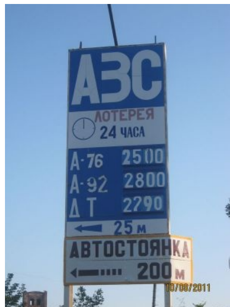
АЗС около ЦКЗ (или как он теперь называется)