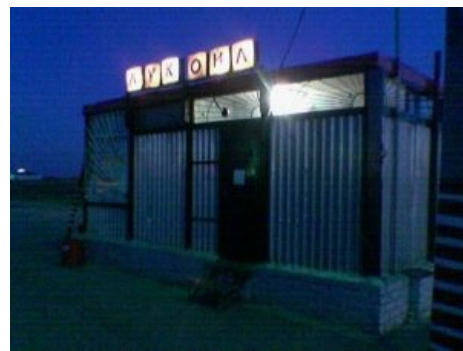
Адыгейский Лукойл в одном из аулов Республики

Место обитания диких животных и туристов. В настоящее время диких животных остаётся всё меньше, а диких туристов становится