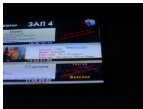
Нянка по вызову — адыгейский блокбастер

Недавно в состав городского образования «Вышеупомянутый» включили говностанцию Ханская, которая с полным соответствием ВП населена исключительно русским населением. В основном правда, подвидом быдло с МПХ и просто ТП . Главным развлечением у оных являются гонки на «мациклах»™ и проверка более чем хуевых способностей говноакустики. ТП легко и быстро раскидывают рогатки, чем снискали себе непомерную славу в соседних аулах. Рассадник «хуевых» болезней. Алсо имеется Колизей «Турист», ныне почивший в бозе. Быдлота, в основной массе, вырачивает овощ , на лут ™ от которого и существует. Озалупивши бабло у колхозников старшего возраста, идут бухать Ягуар . Тем не менее, большинство жителей Ханской уверены в ниибательски расовой верности станицы, в связи с чем у молодежи процветает ФГМ на фоне национал-социализма.