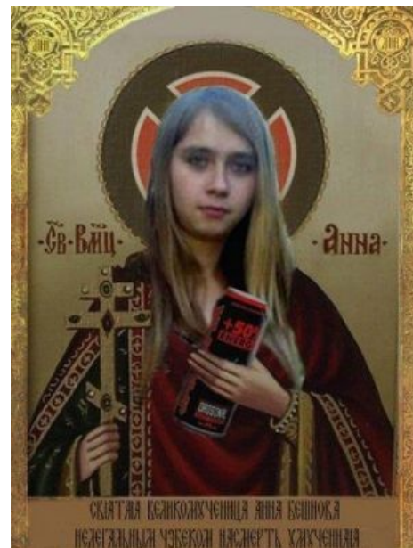
Икона святой великомученицы