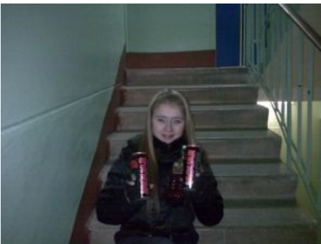
Пеар «Яги». Never gonna give you up