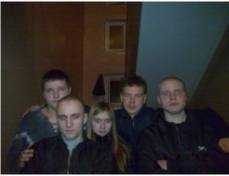
Компромат: Аня с подозрительно обритыми друзьями