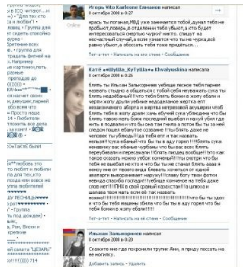
Скрин рейда на стену покойной