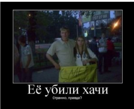
Не желай другим того, чего не пожелал бы себе

администрация контакта беспощадно удалила все 17 аккаунтов лже-Бешновой.