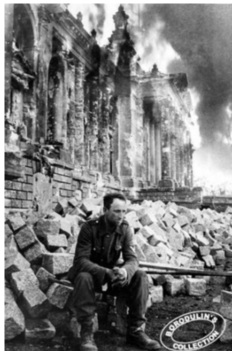
Опять эти русские жгут. И что примечательно — это солдат дивизии СС «Шарлемань», то бишь француз