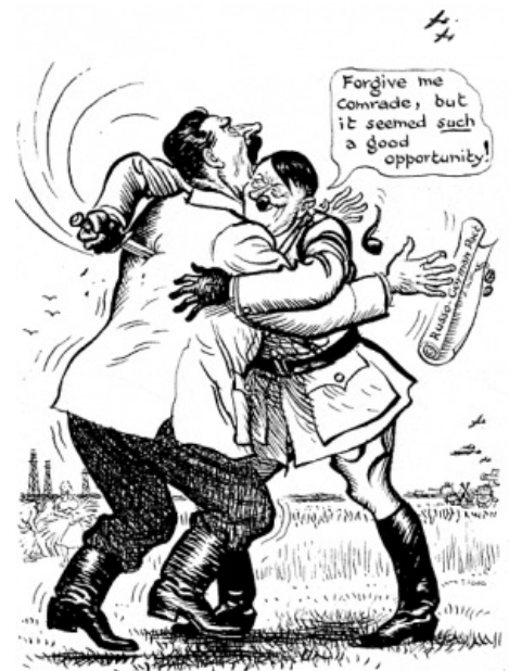
Еще короче о начале войны в представлении английского карикатуриста

Во всём виноват великий злой гений Сталин!!! Сперва он загнал в концлагеря свой народ, чтобы тот клепал танчики и самолётики, а потом захотел загнать в концлагерь весь остальной мир. Но для этого ему нужен был Ледокол Революции™, который нарушил бы мир и покой в Европе. После чего его нужно было устранить расчётливым ударом ледоруба по лысому черепу. На роль Ледокола был выбран Бесноватый. Сталин привёл Гитлера к власти, продавал ему нефть, хром, молибден и прочие стратегические ништяки,