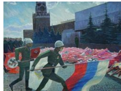
Кое-кто воевал против СССР и под имперским триколором

Вышеперечисленные методы на ура проходят на абсолютно любом ресурсе, даже предельно далеко от военной тематики. И наоборот, чем дальше ресурс от военной тематики, тем меньше на нем реально разбирающихся в теме людей, поэтому лулзов будет даже больше.