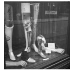
Магазин протезов. Лондон, 1946