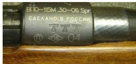
Трофеи: «сделанный в России» затвор германской винтовки 40-х годов