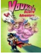
Невероятные Вовкины приключения