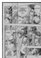
Ах ты ж ёбаный ты нахуй! (фейк)