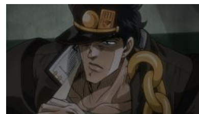
ОЯШ Джотаро в обычной такой школьной форме.

JoJo's Bizarre Adventure (мооп. Jojo no Kimyō na Bōken — рус. Странные приключения ЙоЙо ака жожо, жожжа, йойо; быдл. жижа ) — японская манга, древней интернетов, до сих пор живущая и породившая в девяностых пару фейловых ОВАшек, а несколько лет назад — хороший, годный ТВ-сериал, ныне полностью охвативший события пяти частей манги (из восьми). Каждая часть — независимая история со своим набором персонажей, причём имя главгероя каждой части можно сократить до ДжоДжо (Джонатан Джостар, Джозеф Джостар, Джотаро Куджо и т. д.). Да, они родственники .