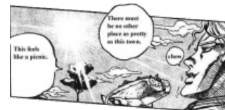
Тот самый Duwang.

Очень популярная фраза в комьюнити ДжоДжо. Обычно адресуется тем, кто посмотрел аниме-адаптацию и уже начал считать себя труп-фанатом. Как правило, те либо удивляются существованию манги, либо начинают