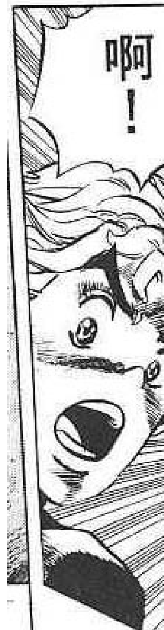
Тот самый Duwang.