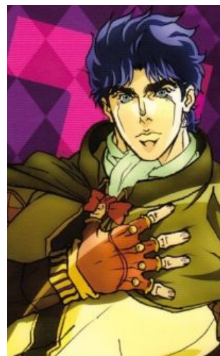
Многочисленные ГГ серии: Джонатан Джостар