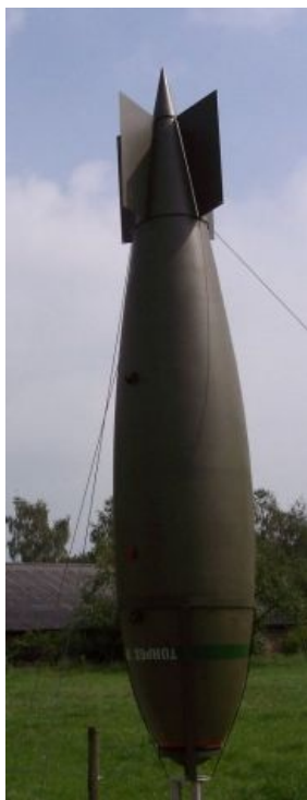
Сейсмическая бомба «Толлбой»