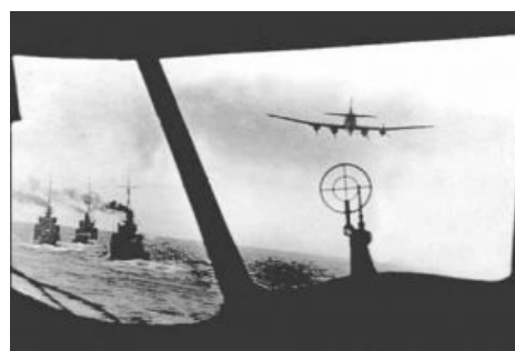
«Кондор» над конвоем [5] .

когда Советы получали звездолей после очередной неудачи под Харьковом, а англичане получали аналогичных звездолей в Ливии и готовились эвакуировать Александрию. Как и все конвои весны-лета 1942 года, этот был самым большим . Что неудивительно, поскольку корованы в Россию вообще отличались большим количеством судов, которым пришлось вернуться: то проблемы с машиной, как на «West Gotomsk»; то на скалу наскочат, как «Ричард Бленд»; то повредятся об лёд, как «Эксфорд» и танкер «Грей Рейнджер». В совке за такое назначали врагами народа, а гуманные союзники вздыхали, чинили и отправляли со следующим корованом, поэтому каждый следующий корован становился всё больше и больше. Впрочем, с военнообязанными такое не проканывало, поэтому флотский танкер «Грей Рейнджер» остался выполнять обязанности дойной коровы, хотя в ордере конвоя был заменён на «Алдерсдейл».