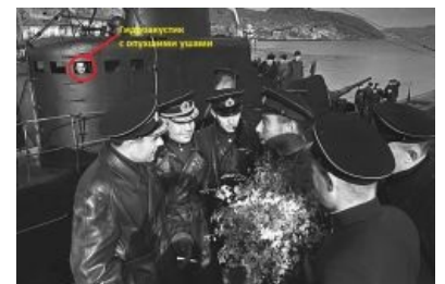
Торпедоносная лодка К-21