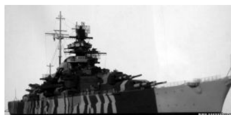
Ферзь — «Тирпиц» в прикиде лета 42-го года

Ещё весной шибко умный адмирал Редер предложил хитрый план под названием «Ход конём» (нем. « Rösselsprung »), по итогам которого немцы должны были помножить на ноль минимум один конвой. В основу плана был положен прокачанный немцами скилл — «орднунг». Благодаря чёткому взаимодействию и жёсткому подчинению всех имеющихся сил одному начальнику планировалось взять островитян за жабры, измордовать постоянными разносторонними набиганиями небольшими группами юнитов, постепенно расхуячить все силы прикрытия и добить кораблики с ништяками подлодками и авиацией.