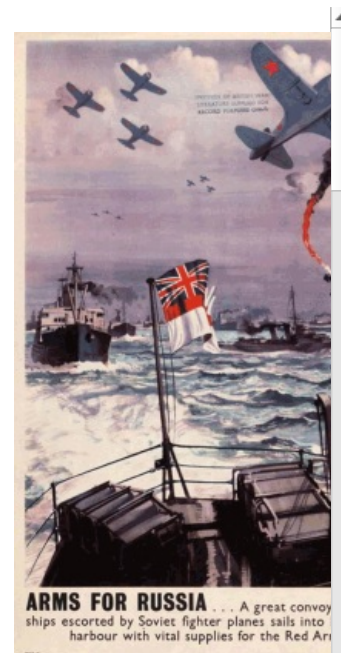
Ожидание: машем флагами, тащим ништяков

«Мы окажем России и русскому народу всю помощь, какую только сможем. Мы обратимся ко всем нашим друзьям и союзникам во всех частях света с призывом придерживаться такого же курса и проводить его так же стойко и неуклонно до конца, как это будем делать мы. »