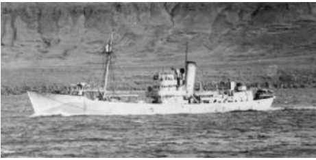
HMS «Ayrshire». Гроза Люфтваффе и Кригсмарине