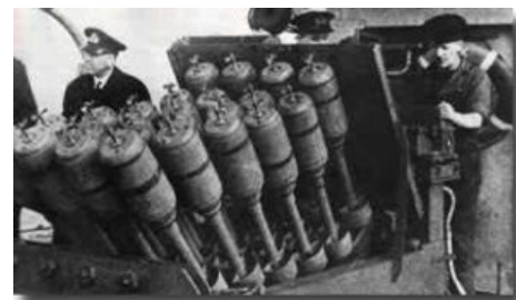
Военно-морской Йожег и його иголки

Строго говоря , арктические конвои для англо-саксов всегда были чем-то вторичным, главной же темой были атлантические конвои . Дядю Джо можно было послать под благовидным предлогом, можно было по полгода вообще ничего не возить по арктическому маршруту. Но дорога через Атлантику должна была работать без перебоев, епть, для Британии это была дорога жизни. А там могли мешать и мешали только U-Boote, и с ними нужно было что-то делать. И таки сделали: