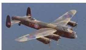
Avro 603 Lancaster