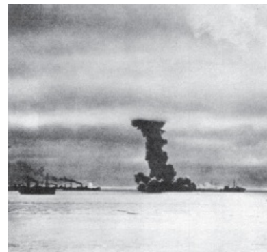
— Азербайджан! — Ранил!

Как отметил один из участников событий, они были похожи на грязных серых уток. Но никто не знал, какую славную утиную охоту устроит волчья стая «Ледяные дьяволы» и орлы Геринга. Не знали, но некоторые догадывались: мореманы с американского «Трубадуэ», узнав, что конечным пунктом будет Архангельск ( а разгадка одна : Люфтваффе своими постоянными бомбардировками выпилили чуть менее, чем весь Мурманск), устроили день неповиновения, но военная команда корабля загнала их в трюм, после чего они дали согласие плыть дальше. Впрочем, тёртые ребята с этого судна, набранные по тюрьмам и лагерям для перемещённых лиц, сразу после выхода в море решили, что разукomплектованные танки русским пригодятся больше, чем никакие, взломали пломбы с танков, расположенных на палубе, и изучили их на предмет пострелять по самолётам и подводным лодкам.