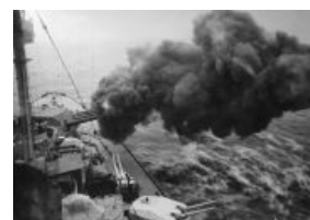
пафосный залп в никуда

Ещё 30 октября 1942 бритты послали в Тронхеймс-фьорд мирный рыболовецкий катер «Артур» с управляемыми торпедами на буксире (операция «Тайтл»). Но уже на подходе начался шторм, и торпеды потеряли. Команда затопила катер и пешком пошла к шведской границе.