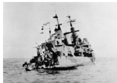
«Эдинбург» с повреждениями зада кормы и дырочкой в левом боку