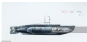
Мини-сумбарина Королевского Флота