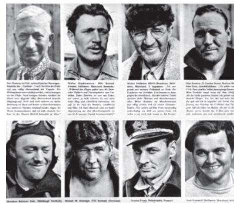
Им выдали сухие штаны

Были неудачники и с противной, во всех смыслах, стороны. Несмотря на происходящее веселье, две подлодки из стаи «Ледяные Дьяволы», U-408 и U-657, проболтались в море по двадцать дней и никого не нашли. Но особыми неудачниками со стороны немцев, на уровне премии Дарвина, выглядят пилоты FW-200 «Кондор». Эти четырёхмоторные вундервафли, хоть и могли нести бомбы, но использовались как дальние разведчики. И вот один из них обнаружил английское судно «Бэленгхем» и рядом спасателя «Рэтлин». Молодцы. Но пилоты решили поучаствовать в охоте более активно, и зашли на «Бэленгхем»