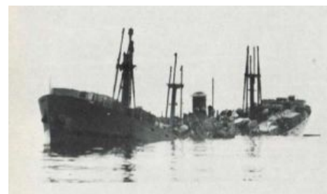
Хрусть и пополам. Эмблема PQ-17 [6]