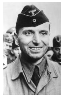
Рекордсмен плохо выбрит, брутalen и доволен результатами