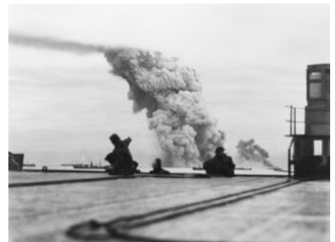
Кто-то в Мурманск не доехал. PQ-18

Слегка охуев от оглушительной проводки «конвой в ад», джентельмены стали чесать репы и думать, как теперь выполнять свои обязательства перед усатым игроком в красных трусах. Шизофазия в духе «ну их, эти конвой» возобладала, но была прервана Отцом, которого Художник имел под Сталинградом. Плюс, после сокрушительного поражения бриттов под Сингапуром, узкоплёночные япошки втыкались в карту Индийского океана и готовились отредактировать ее: перекрасить в собственные цвета Индию, Бирму и прочие милые кусочки британской империи. Плюс кровавые конвой на Мальту. Позвонив калькулятором и сложив 2 и 2, решили продолжать. 2 сентября конвой PQ-18 пошёл в Мурманск. Впервые в состав ближайшего эскорта, прямо в ордер конвоя, включили авианосец, кстати, только что построенный.