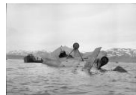
...и его печальный конец

«Тирпицем» не было ни дымовой завесы, ни облаков, налёт таки увенчался эпичным успехом . Два «Толлбоя» пробиты броню и подожгли пороховой склад — ёбнуло так, что башню С снесло КЕМ. В итоге через несколько минут «Тирпиц» вместе с 1000 морячков пошёл ко дну, которое было недалеко, а потому сколько-то человек гансы спасли просто вспоров днище перевернувшегося «Тирпицу». У бриттов же потерь не было, а экипаж единственного подбитого с корабельных ПВО пепелаца спасся в полном составе, приземлившись в Швеции. Причём хваленые асы Люфтваффе вообще не смогли помешать бомбардировке ( himmelherrgott!!! ).