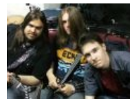
Зулин с каким-то чуваком и своим либерально настроенным другом