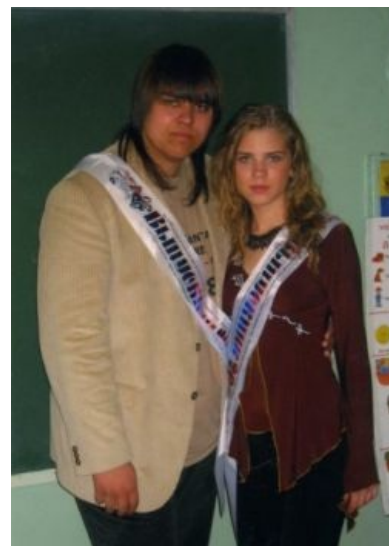
Уже не школота. Теперь можно делать обзоры

В отличие от своего более популярного оппонента, Витас старается придать