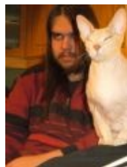
Зулин и нека