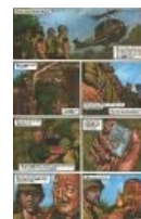
Она же в Crisis