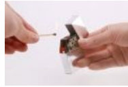
Комплектация для неимущих