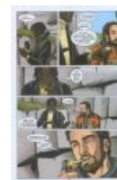
Она же в Y:The Last Man