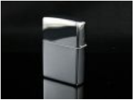
Параллелепипед в вакууме