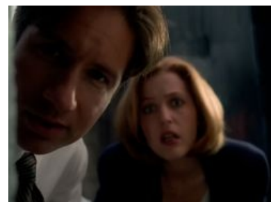
Малдер и Скалли увидели тебя.