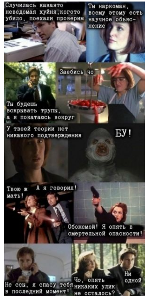
Типовой сценарий любой серии

Параллельно всё это время рядом бродят агенты ZOG и летают тарелки, а иксы лепятся на окна.