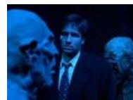
Малдер смотрит на статую устало и печально