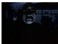
Смотрит на тебя с недоумением что ли...