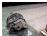
Какой-то извращенец замаскировался и смотрит под юбки лоли.