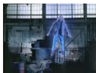
Нечто неведомое... и плохо пахнет.