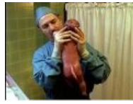
Чернобыль такой Чернобыль. А если найду?