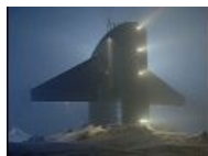
Подводная лодка подо льдом Аляски.