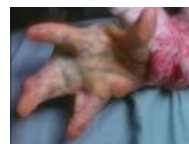
Последствия постоянного фаната мутации.