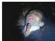
Из горла вырос МПХ...