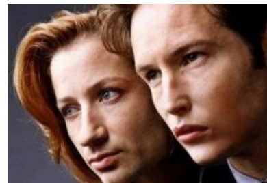
Скалдер и Малли

Актёр Дэвид Духовны — ЕРЖ -полукровка пшецко-хохлацкого происхождения ( пруф ) (хотя недавно твитнул о том, что сам себя считает укрот). Олсо, правильное произношение фамилии — Молдер, но всем, как всегда. Пиндос голландского происхождения, окончив школу, уехал в Оксфорд, 6 лет пинал хуи на психфаке, младшую сестру на его глазах похитили злые пришельцы, и Малдер пошёл в Академию джедаевнапарников ФБР , чтобы убить всех инопланетянов . Там, как положено главгерою, стал отличником, умняшкой, спортсменом, комсомольцем и участником всех КВН и ЧГК . Вследствие чего его заприметили Большие Боссы и отправили раскрывать особо тяжкие в Отдел убийств, где он снова смог