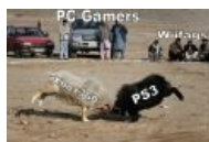
/vg/ до выпила консольщиков