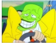
Маска троллил до того, как это было круто