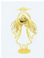
To Aru Majutsu no Index