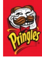
Чипсы для троллей