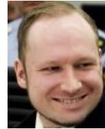
Суровый тамплиерский трололофаце