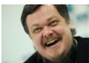
РПЦ тоже троллит