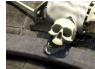
Последний кулфейс Мачомена