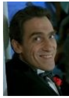
Кулфейс в исполнении Гаркалина