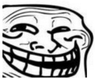
Trollface смайл (:D))