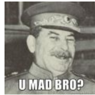
Друг и учитель всех прогрессивных троллей