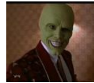
Позеленевший Джим Керри, бляеть!