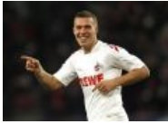
Ногомячер Лукас Подольски