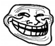
Пикселизированная версия в HD