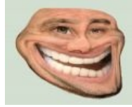
Jim Carrey trollface