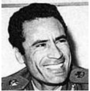
Троллил ZOG 40 лет, за что и был им жёстко выпилен