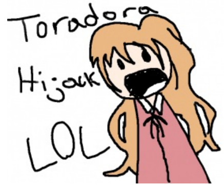
Тайга захватывает /a/