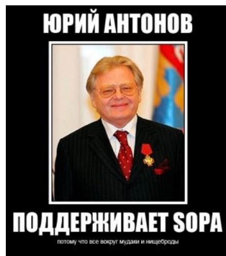
Главный копираст русской эстрады

https://www.youtube.com/watch?v=mJWMy2Gj6E