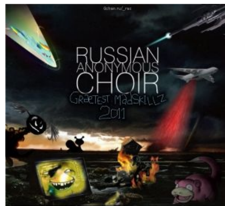
Обложка первого альбома

RAC был создан 15 Апреля 2011 года на мятной борде, где для группы была запилена 2.0-доска. Изначально проект планировался как саморегулирующаяся платформа для совместного музыкального творчества с большим и непостоянным составом. В первый же день преисполненные энтузиазма создатели ракача пиарили проект на всех бордах, но поначалу он не вызвал особого энтузиазма. Были записаны и выложены на рыгост первые варианты песен «Не возвращайся никогда» и «Гимн операции Cherry Blossom », которая впоследствии пошла в OST сосача . Потом был запилен пиратенпад , и движняк ракача перебрался с 2.0 доски туда. Тогда станок раковцев заработал на полную, наштамповав более десятка песен и перепевов классиков русского рока . К проекту присоединились полтора новых участника, не принимавшие, однако, активного участия в деятельности хора. Появился канал на Тытрубе. Как раз перед новым 2012 годом RAC разродился сборником мэдскиллзов , которому предшествовал эпичный недельный тред, в котором аноны пели песню «Новый Год» . С начала 2012-го RAC ушёл в отпуск, продолжая копить материал для новых песен.