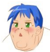
Главный фанат Lucky☆Star (один из шаржей Скетч-куна).