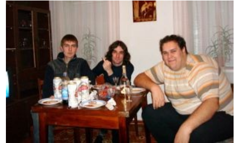
Redbull IRL ( крайний справа)

Около 3 см! Симпатично, да? Классно? Старомодная школьная форма! Развернёмся? БУН! Оттянемся? Сделаем это? Не забудьте поймать и отпустить, йо! Я говорю - уууу! Я говорю - уууу! А теперь рванём! ЛЮБИМЫЙ! ЛЮБИМЫЙ! ПОЖАЛУЙСТА! Пора поговорить! Что-то надвигается! Я так тебя люблю! Ой! У меня не получилось! Щипчики для ногтей! Стальная бита! Гурман!