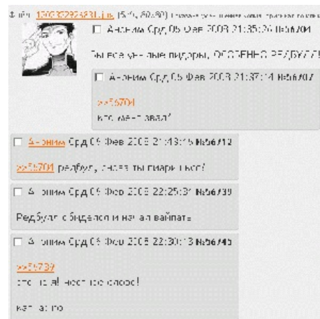
Тот самый тред.

В ночь, когда в /а/ должны были взять 60К-гет , некоторые аноны высказывали опасение, что его возьмет Коната или коняшка. Их опасения сбылись чуть более, чем полностью. Несмотря на обильное число желающих все зафэйлить (и тоже посвятить гет Рэдбуллу, запостив лого соответствующего напитка), число «поймала» созданная специально для этого фотожаба. Только вместо «60000» на ней красовалось число «59999». Никто так и не понял, вин это или фейл (формально, это не гет, но сам факт, что имя Рэдбулла стало крепко связано с фейлами, нельзя не назвать забавным). Тред