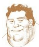
И набросок — а глазки-то хитрые!