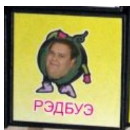
Рэдбуэ (оригинальная фотожаба).