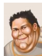
Серьезное изображение Рэдбулла от этого же художника.