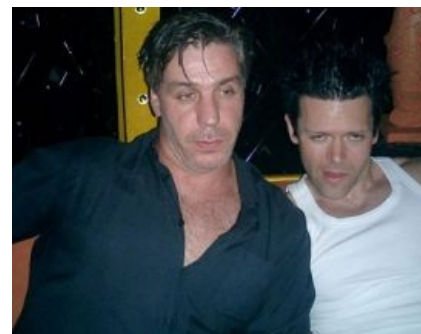
Тилль и Рихард в говно.