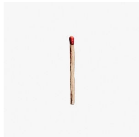
Минимализм в расцвете сил

Пока слухи шли рекой, в 2016 шестеро бравых всадников опять поехали в тур по летним фестивалям и опять без повода, который, как ни странно, по меркам постаревших Раммов оказался хорош благодаря работе со светом и вытаскиванием на публику одной новой и нескольких давно забытых песен . Однако, поехав с той же программой в 2017, умудрились слить её в толчок хуёвым голосом Тилля и общей унылостью других музыкантов вкупе с пивным животиком Солнцецкого. Попутно для работы над альбомом наняли абсолютно нового продюсера, сводившего лайв для трасх-группы Kreator, чем ввели всех в состояние ахуя. По новостям, в мае 2018 процесс непосредственно записи альбома был завершён, а в сентябре были записаны хоровые и оркестровые аранжировки, ВНЕЗАПНО, в Минске . 8 февраля 2019 случился эпичный вброс трека с расово верным названием Hare Krishna. Все бы ничего, да только трек принадлежал российской группе ATOW, а весь мир ожидал триумфального возвращения немцев, так как был пущен слух, что это именно их песня. Количество поисков глубинного смысла и хейта приняло такой оборот, что хватило до выхода настоящего сингла, получивший патриотичное название «Deutschland». Сам же альбом, который не мудрствуя лукаво назвали Rammstein , вышел 17 мая 2019 года.