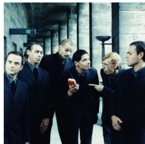
В полном составе охуевают от более виртуозных коллег.

Музыка для сабжа скорее является приложением, чем основой, поскольку в этом плане не доставляют совсем. Основной упор же группа делает на живые выступления, где музыкой не радуют вообще, но зато есть тонны огня, искр, пены, доставляющая театральная постановка и конечно же лулзы . Также стоит упомянуть достаточно годные клипы, где иногда прослеживается связь между сюжетом и текстом песни. В этом плане годнота шла вплоть до 2006 года, пока у режиссёрского руля не оказался новый режиссёр Окерлунд, снявший четыре однообразных клипа-перформанса. И если первые два («Mann Gegen Mann» и «Pussy») ещё хоть как-то можно оправдать, где там худо-бедно видеоряд соответствовал тематике песен, то остальные — полный слив. В этот тёмный период вышло одно годное видео, благодаря старому-доброму режиссёру с которым группа работает с начала нулевых, но потом, ЧСХ , вновь вернулся Акерлунд, снявший клип в попсовом духе и с закосом под ретро в стиле «пляж-девочки-секс-коккс». Понятное дело, что шведа выкинули на мороз (но, сцуко, опять его вернули, чтобы снять новый лайв-DVD), а его место занял другой перс, снявший тройку годных клипов для группы. Подробности тут . Впрочем, с клипом «Deutschland» парни явно вернулись в колею.