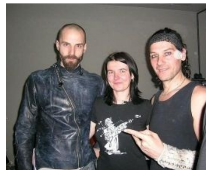
Ритм-секция и поклонница .

Шнайдер смотрит с прищуром и как бэ намекает , а Пауль смотрит на тебя, как на фаната .