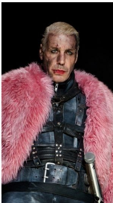
Образ Линдемманна в 2013.

После выхода «Розочки» Раммштайны уходят отдыхать, и надолго. Чтобы интерес к группе во время отпуска не остужался, был выпущен сингл с клипом на « Mann Gegen Mann », а Рихарду было дано задание время от времени шуметь.