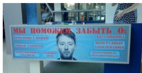
Том Йорк всем поможет