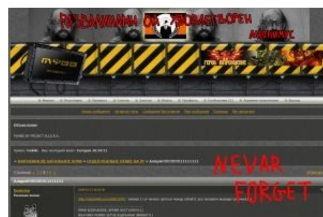
Ваш дизайн — говно