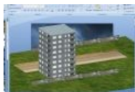
Это типа 3d

Презентация в поверпоинте - неременный атрибут курсовых и дипломных работ в большинстве ВУЗов этой страны. Алсо применяется широкая практика засаживать студюзов стряпать в PPT методические пособия в счет производственной практики.