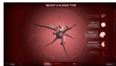
Сегодня у Смерти в кармане грибы

Отдельно представлены сценарии с уникальными болезнями вроде черной смерти, оспы, СПИДа (выпилен толерастами до выхода, но не исключено, что еще вернется) и т. д. с набором особых же способностей и симптомов — естественно, во всех самых мерзотных подробностях, списанных с реальных прототипов.