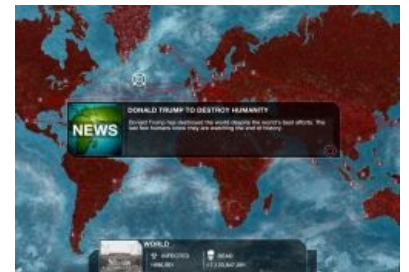
Ничто не спасет нас от Трампа

«xxx: Играю тут в плагу, назвал свою болезнь " попоболь ".