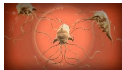
Мозговое червие смотрит на тебя как на нулевого пациента