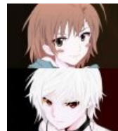
To Aru Majutsu no Index