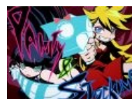
Backlace & Stripes — оружию тоже нужны имена