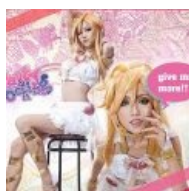
Годный косплей Труськи