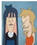
Бивис и Баттхед