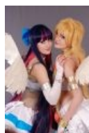
Косплей обеих сестёр