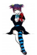
Стокинг по версии ычанеров