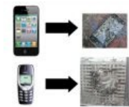
Если уронить в квартире