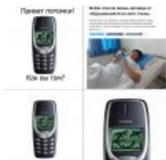
Nokia спасает жизни