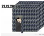
Конец света? Всем похуй