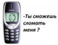
Ты сможешь сломать меня?