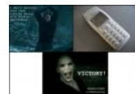
Расово неверный клон Nokia 1100 в чехле