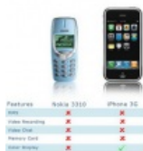
Nokia vs Iphone