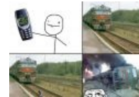
Может случайно перемещать себя и владельца в пространстве и времени