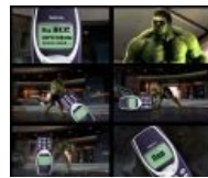
Nokia 3310 vs Халк