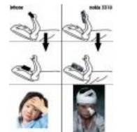
Есть у него и недостатки