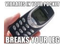
Виброзвонок в кармане ломает тебе ногу