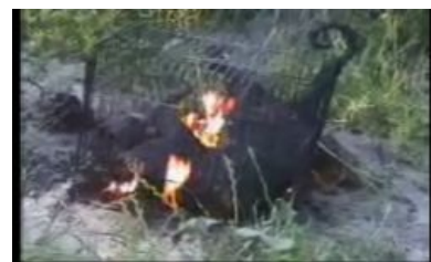
Скриншот из ролика.