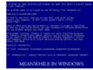
Meanwhile BSOD in windows