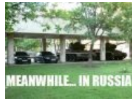
Meanwhile in Russia 2: ВНЕЗАПНО автострадные танки!