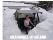
Meanwhile in Finland