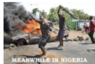
Meanwhile in Nigeria