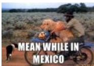
Meanwhile in Mexico