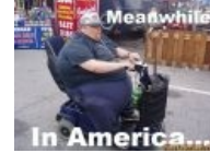
Meanwhile in America 2