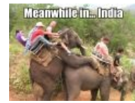
Meanwhile in India