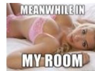
Meanwhile in my room