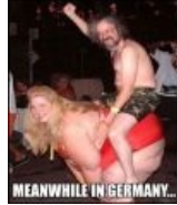
Meanwhile in Germany