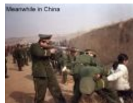
Meanwhile in China