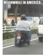
Meanwhile in America