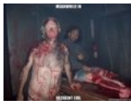
Meanwhile in Resident Evil