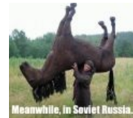
Meanwhile in Soviet Russia: a horse rides YOU!