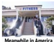
Meanwhile in America