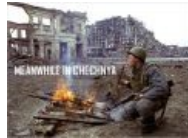
Meanwhile in Chechnya