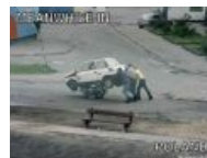
Meanwhile in Poland