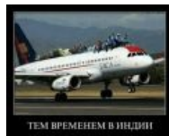
Meanwhile in India. Даже жаль, что (спойлер: ТАСА из своей Мексики до Индии не долетает.)