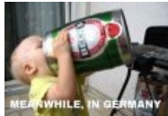
Meanwhile in Germany, part 2