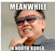
Meanwhile in North Korea