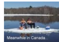
Meanwhile in Canada