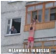
Meanwhile in Russia