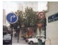
Meanwhile in France