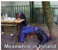
Meanwhile in Ireland